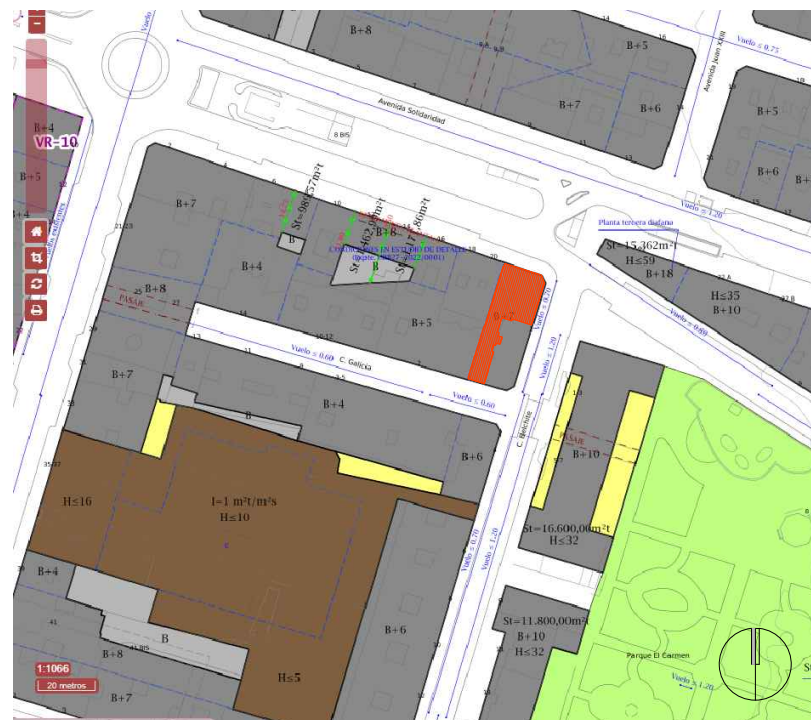
EMPLAZAMIENTO DEL LOCAL SITUADO EN C/ BELCHITE, 2